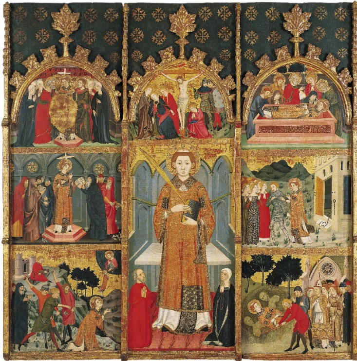
Jaume Serra, Retaule de sant Esteve, cap a 1385. Museu Nacional d'Art de Catalunya, adquisició de la col·lecció Plandiura, 1932.